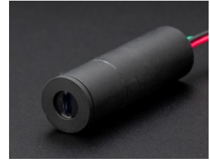
φ10 mm 高放熱ハウジング (高出力対応)