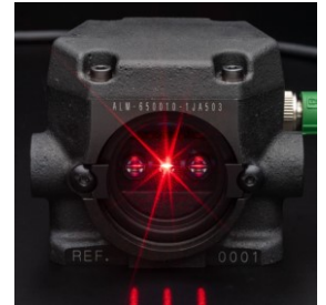
パラレルラインTYPEのハウジング